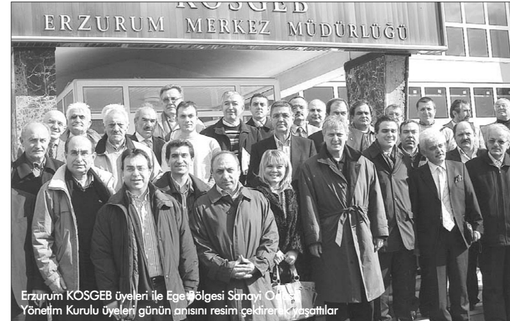
Erzurum KOSGEB üyeleri ile Ege Bölgesi Sanayi Odası Yönetim Kurulu üyeleri günün anısını resim çekiyor.